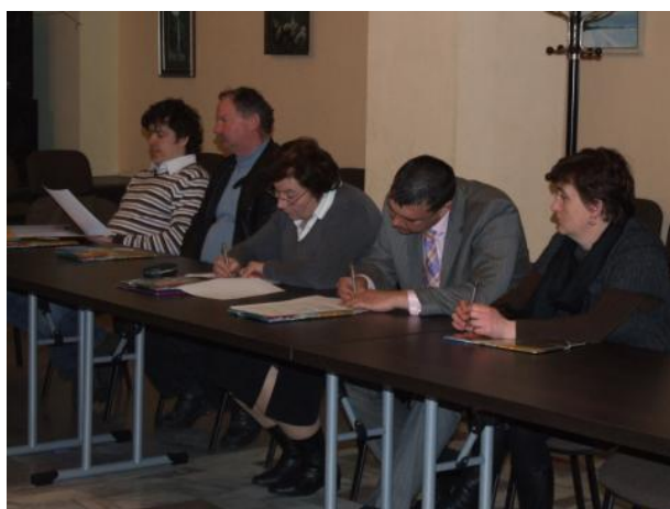
Fot. Spotkanie aktywizacyjne w GCKiS w Jabłonninie, 01.02.2011r. (na fot. członkowie Komitetu LGR reprezentujący sektor rybacki)