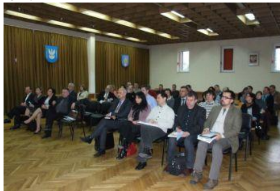
WZC "Lokalne Grupy Rybackiej Zalew Zegrzyński", dn. 08.02.2011r. Na fot. Członkowie LGR.

Opracowana w powyżej opisany sposób Lokalna Strategia Rozwoju Obszaru Rybackiego „Lokalne Grupy Rybackiej Zalew Zegrzyński” będzie dobrze służyć możliwemu do zrealizowania procesowi rozwoju sektora rybackiego na obszarze. Zostało to zapewnione poprzez: